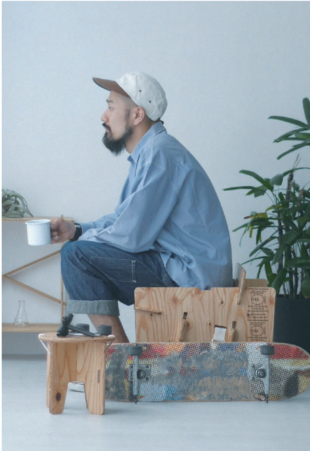
PANEL SHELF, PANEL STOOL, PANEL CHAIR