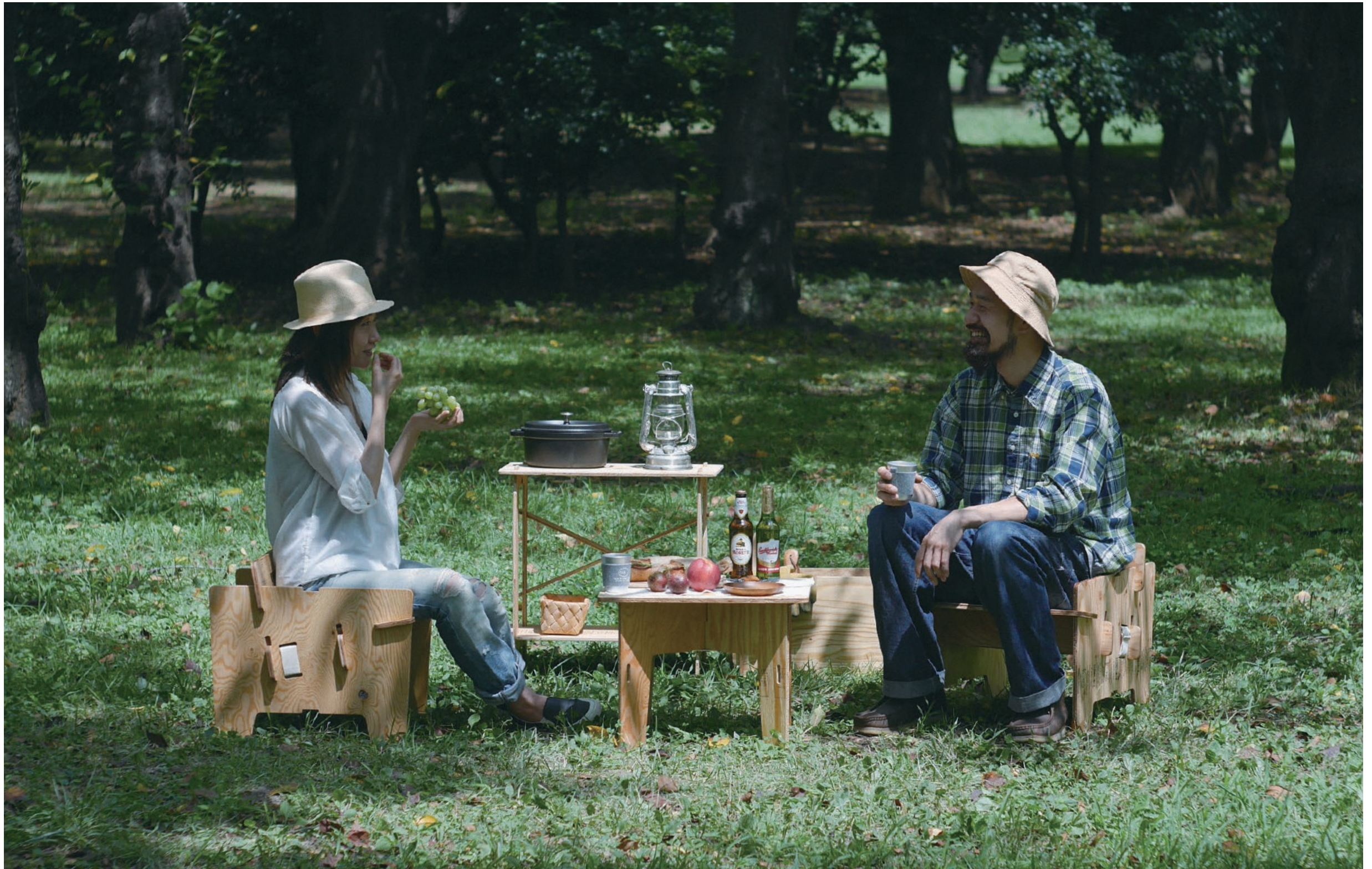
PANEL CHAIR, PANEL SHELF, PANEL TABLE, PANEL TOOLBOX, ALUMINUM TUMBLER